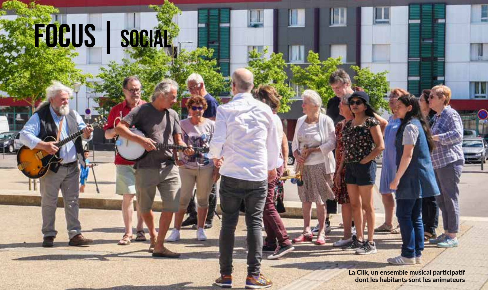
La Clik, un ensemble musical participatif dont les habitants sont les animateurs

P arentalité, aide aux démarches administratives, orientation vers les dispositifs d'aide sociale, groupes de parole, offre d'animations et d'activités ciblées par public, les espaces d'accueil et d'animation (EAA) de la Ville d'Auxerre sont des lieux de lien et de solidarité qui se réorganisent en ce début d'année. Avec un double objectif : être plus accessibles aux différents publics et contribuer à améliorer la participation citoyenne à la vie locale notamment par la création de conseils consultatifs (voir interview Emmanuelle Miredin ci-contre).