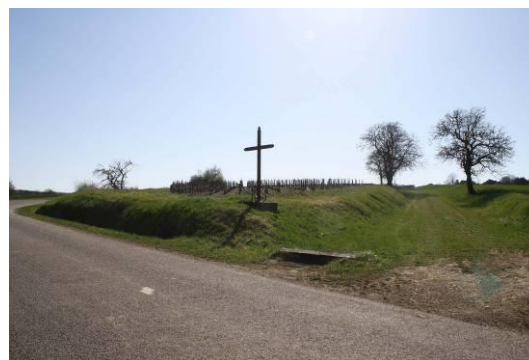
Exemple de chemin rural

Pour réduire l'impact des déplacements, le maintien des chemins ruraux et des ruelles sera favorisé. De plus, un développement des circulations douces est envisagé. Il est également souhaité de poursuivre le covoiturage, car de nombreux bleignacois travaillent à Auxerre.