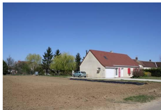
Exemple de « dent creuse »

Il est souhaité une urbanisation fortement limitée du hameau de Thorigny , afin de préserver son statut de hameau et surtout de limiter le développement des réseaux et l'usage de l'assainissement individuel au profit de l'urbanisation du bourg, lieu de centralité et d'équipements.