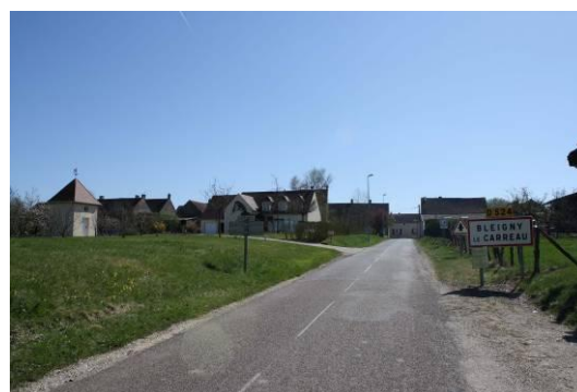
Exemple d'entrée de village

De plus, le bâti ancien et dense du village mérite d'être préservé, et certains éléments du patrimoine, tels que le lavoir ou les calvaires pourront être identifiés comme des éléments de patrimoine à protéger.