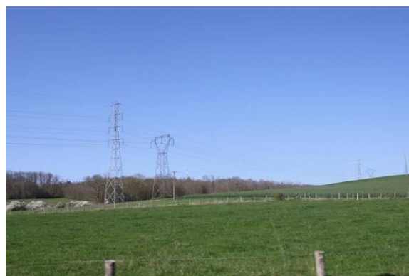
Le Thureau de Saint-Denis