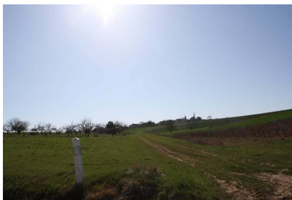
Les paysages entre agricultures, viticulture et arrière-plan boisés